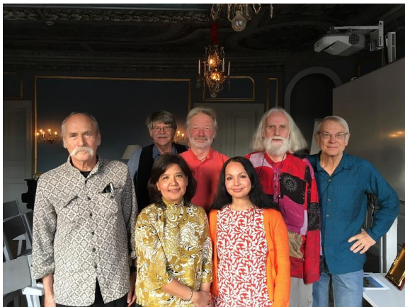
Network – Sweden. (Se bild.)

Den 22 oktober berättade vi om vår verksamhet under titeln: ”KMCH bygger vidare på sitt skolhem i Det gömda Himalaya. Film, bilder, berättelser och skönsång.”