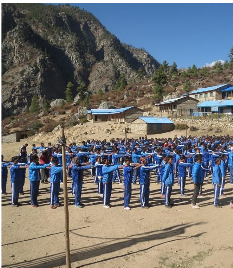
Skolgården och några av skolans byggnader.