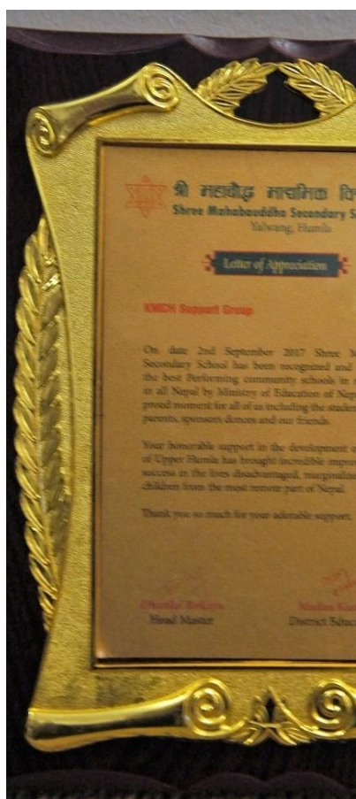
Vårt diplom med tack från skolan.

Det har till och från varit svårt tala i telefon med skolhemmet i höst, och för att skicka bilder måste någon gå två dagar till huvudorten Simikot. Men häromdagen kom jnågra bilder och julhälsningar från barnen, varav några visas i nyhetsbrevet, samt lite information från Chembal. Notera hur uppdaterade barnen är om vårt julfirande. Som vanligt arbetar barnen flitigt både på skolhemmet och i skolan. I förra nyhetsbrevet kunde vi berätta om att våra barns skola– Shree Maha Boudha School - i Yalwang av Utbildningsdepartementet i Nepal under 2017 utsetts till en av landets åtta bästa kommunala skolor i s.k. "remote areas". Vi visar här en bild av en plakett som vi i KMCH fått som tack för vårt stöd till och engagemang i skolans verksamhet.