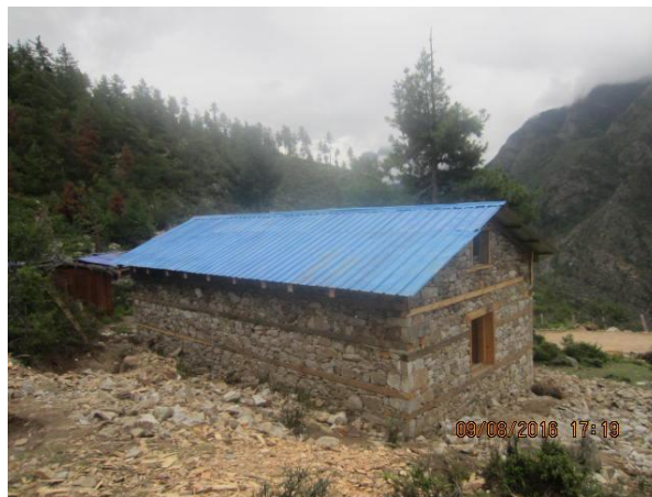
Nya köket i en stabil stenbyggnad.