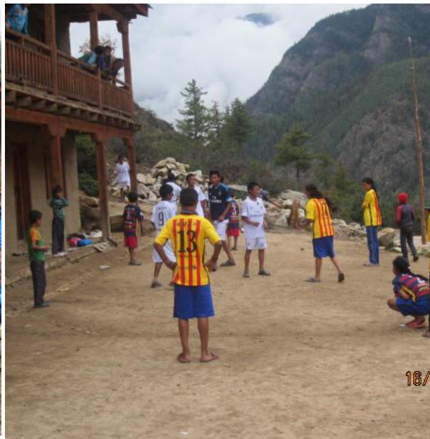
Fotbollsspel i nya dresser