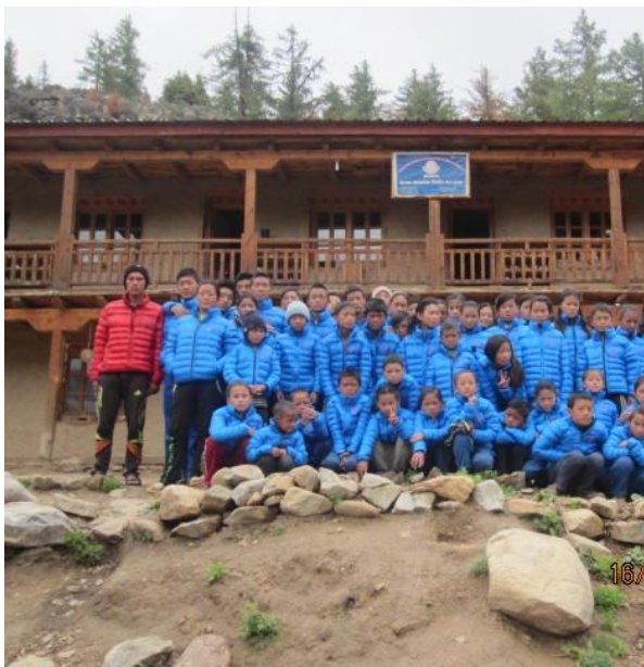
Nya jackor inför den kalla hösten. Gåva från den Taiwanesiska

I våras befarades att det p.g.a. torka skulle bli missväxt i Humla. Hur skörden blev har jag i skrivande stund inte kunskap om. Vi återkommer om detta i kommande nyhetsbrev.