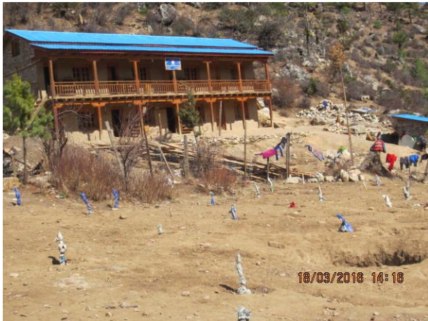
Här ser vi några nya äppelplantor framför sovhuset

Man jobbar på som vanligt på skolhemmet och av bilderna att döma ser det ut som man hunnit långt med det nya köket. Vi ser också att man har planterat nya äppelträd.