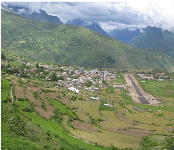
Byn Simikot och dess landningsbana.

Om vädret är nådigt så kan planet till Simikot gå redan strax efter kl. 06 så det blir tidig väckning. Planet lyfter bara om vädret är nådigt både i Nepalgunj och Simikot. Är det blåsigt eller för mycket moln på något ställe så blir det till att vänta till nästa dag. Planen är små så det kan hända att några får vänta i Nepalgunj tills planet återvänder från Simikot för en andra tur. Resan till Simikot tar en timma. Under monsontid kan det ibland bli flera dagars väntan. Som längst tror jag att vi har väntat fyra eller fem dagar i Simikot på lämpligt flygväder. Det gäller således att ha vissa frihetsgrader i planeringen så man inte missar det bokade planet hem till Sverige.