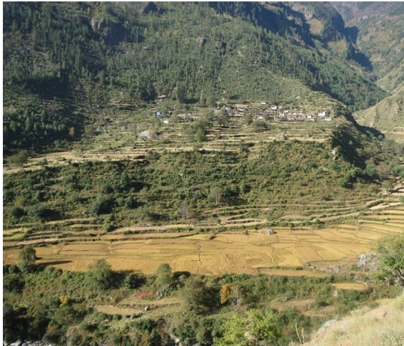
Sista risfälten vi ser. Notera byn ovanför fälten.

åtminstone inte kvinnorna med sina olika smycken och klädedräkter. Se bilderna nedan. Snart bär det uppför och sedan fortsätter det med mycket uppför och nedför.