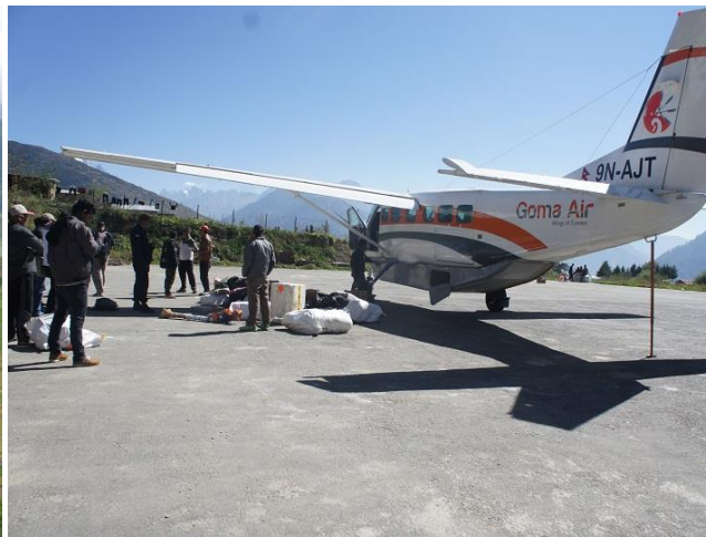
Planen tar 10-12 personer.

Väl i Simikot så kommer vi denna gång att tillbringa dagen där och starta vandringen till skolhemmet först nästa dag. Det blir en viss acklimatisering till höjden, vilket kan vara bra även om vi förlorar en dag på skolhemmet. Simikot ligger på cirka 3 000 meters höjd. Under vandringen bär vi bara våra dagryggsäckar. De stora ryggsäckarna bärs av hästar.