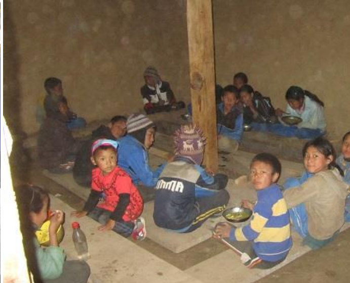
I de nya kan man både äta och plugga i fred även om riktiga bänkar ännu saknas.