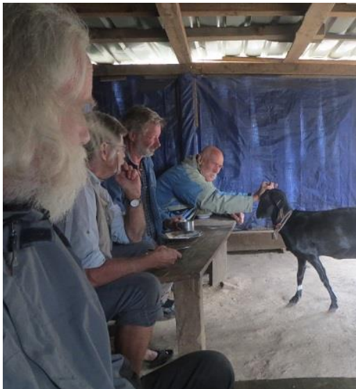
I den gamla matsalen fick man freda sin mat.

med vatten- och hygienprojektet som i princip hann slutföras föregående år. Nu finns det flera tappställen och toaletter. Vi har även kaminer i barnens rum så att de åtminstone tidvis kan ha en sovrumstemperatur överstigande den som är utomhus. På tretusen meters höjd kan nätterna vara kalla även en bra bit in på våren. Med våra mått mätt är deras levnadsförhållande fortfarande mycket primitiva men vi försöker successivt att göra dessa drägligare.