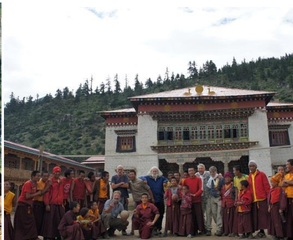
Efter volleybollmatchen 2011

Med årets förstärkning av tre medlemmar – alla yngre än vi styrelsegubbar – hoppas vi kunna ge munkarna på klostret ett bättre motstånd i volleyboll än förra gången vi var där. Jag gissar att munkarna ligger i hårdträning nu.