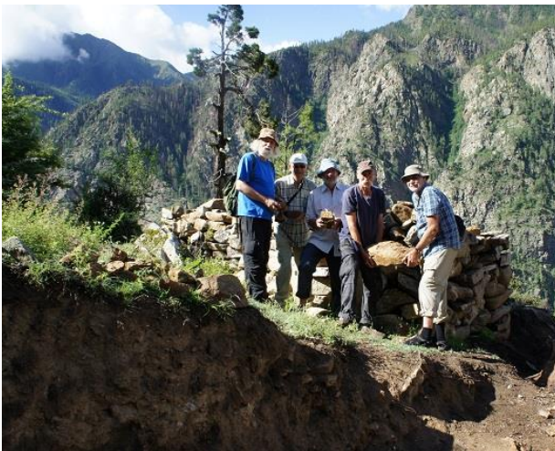
Stenar att användas till det nya skolhemmet 2011

Sommaren 2011 besökte gubbarna i styrelsen Humla. I sommar är det dags igen. Denna gång får vi fem gubbar sällskap av tre medlemmar. Vi ser fram emot att träffa barnen igen och se allt som hänt sedan vi var där år 2011. Då släpade vi sten till det nya skolhemmet och hade vår tältplats där växthuset och köksträdgården är idag. Nu finns skolhemmet i sinnevärlden med sina två våningar och åtta rum.