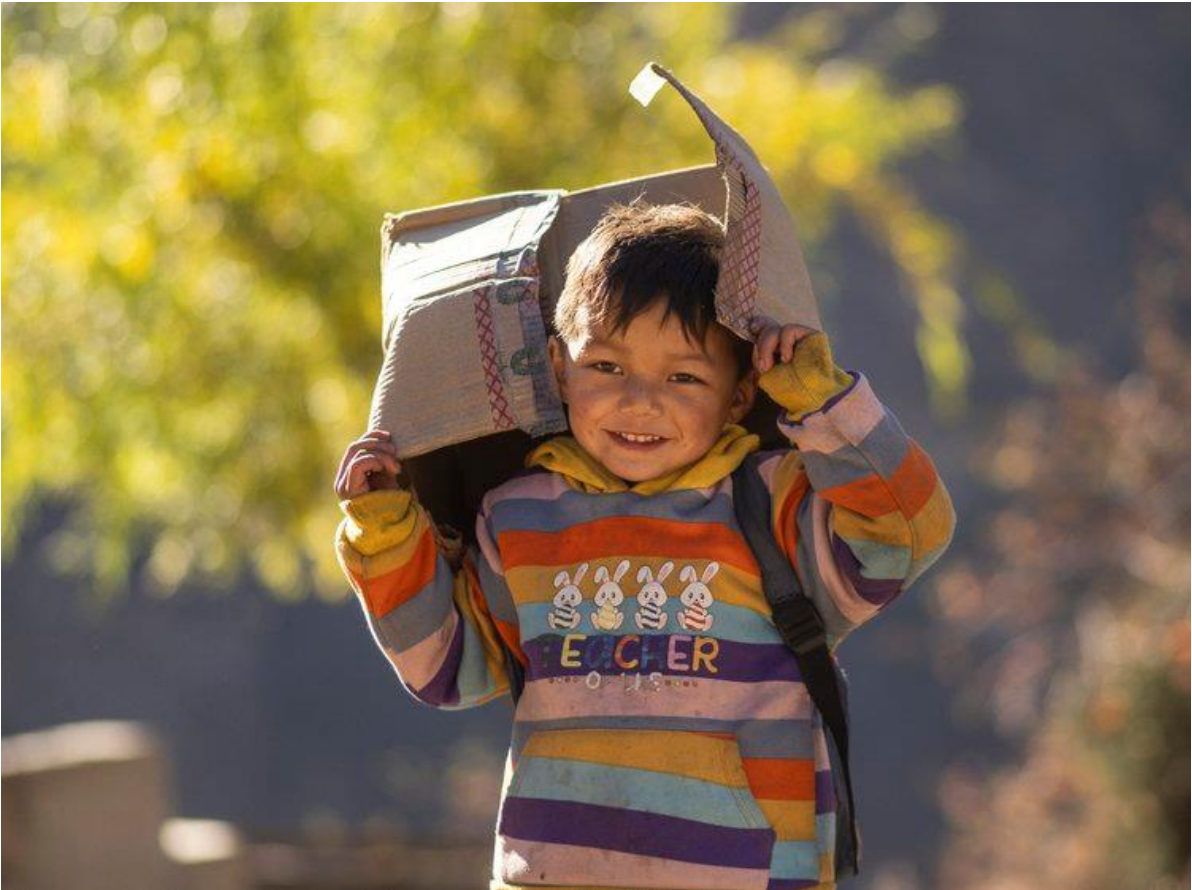
Hälsoläger i Humla